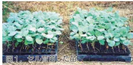
図1. セル育苗した苗

本葉2.5〜3.0枚程度が植え付けの適期です。もしも定植が遅れるようでしたら、こまめに液肥を与えて肥切れをおこさないようにします。また、9cmもしくは10.5cmのポリポットに鉢上げしてやると、しばらく定植を遅らせることができます。