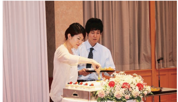
ウェディングケーキにトッピングするカップル