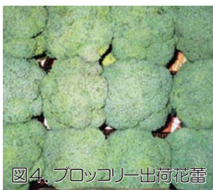
図4. ブロッコリー出荷花蕾