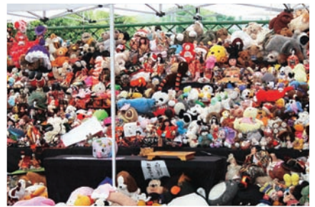
持ち寄られた人形やぬいぐるみ

(株)ジェイエイにしうわは、7月20日ルミエールにしうわで人形感謝祭を開いた。人形やぬいぐるみには魂が宿るといわれ、日が経つにつ