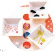
中村玉緒 角豆皿 縁起揃!!