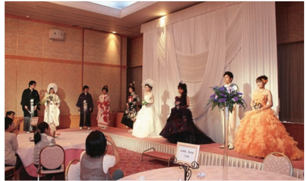
ミニファッションショーの様子