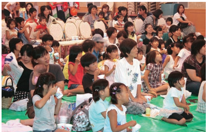
紙芝居に見入る子どもたちと両親