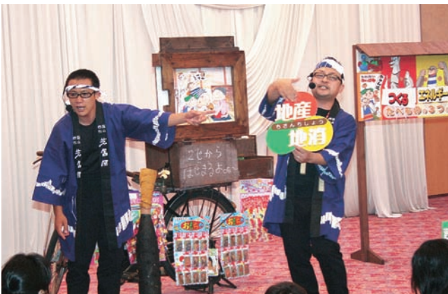
熱演する芝居屋の方たち

JAにしろうわ共済部主催の子ども倶楽部のイベント食育劇「早ね早おき朝ごはん みかん太郎」が7月29日、本店5階スターホールで開かれた。当日は約180名の親子連れの会員が参加した。同イベントはJA共済のメーリアップと普及基盤の拡大及び地域住民に根ざした活動をPRすることを目的としたもの。今年は松山を中心に活動している平成の紙芝居師「芝居屋」による食育劇「早ね早おき朝ごはん みかん太郎」。みかん太郎が食育の大切さと地産地消を盛り込んで大奮闘する姿を芝居屋の方たちが、紙芝居を使いながらおもしろおかしく演じる姿に会場は大爆笑。紙芝居終了後には巨大サイコロゲームで子どもたちは楽しんだ。その他、射的や輪投げゲーム、みかんわたがしやかき氷などもあり、会場は終始賑わっていた。